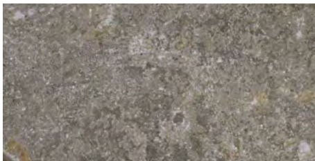
GRIS Abujardado / Bush-hammered